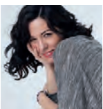
Por Pilar G. Almansa

No vivimos en un país con censura: vivimos en un país donde unos cuantos saben perfectamente cómo copar una conversación, y los demás no saben redirigirla hacia los asuntos que realmente sustentan la estructura productiva. Perdonadme la opinión impopular, pero cada vez que denunciemos su censura, les hacemos gratis la campaña de comunicación. Ojalá pudiéramos generar el mismo impacto cuando hablamos de todo lo demás. Tenemos cuatro años por delante para hacerlo.