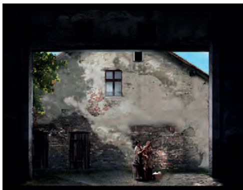
Boceto de Nicolás Boni para la escenografía.

LA ROSA DEL AZAFRÁN. Teatro de la Zarzuela. Del 25 de enero al 11 de febrero.