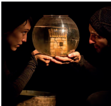
Imagen de Hubo , un montaje anterior de El Patio Teatro.

FERIANTES. Teatro María Guerrero. Del 10 al 28 de enero.